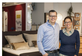
Beispielfoto Auflösung min. 730 x 485 Pixel

Kontaktdaten für eine Kundenberatung zur Bestellung (E-Mail/Telefon/WhatsApp/Skype ...)